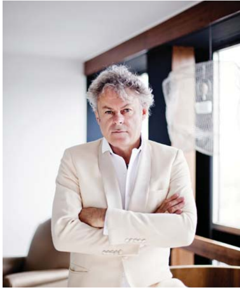
PIERRE-YVES ROCHON ARCHITECTE D'INTÉRIEUR

Il est réputé dans le monde entier pour ses architectures d'intérieur et sa créativité dans le domaine de l'hôtellerie de luxe ou encore de la restauration. Il dispose d'une philosophie axée sur la personnalisation de chacun de ses projets.